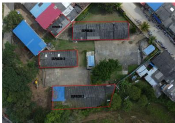
SEDE GABRIEL GARCIA MARQUEZ