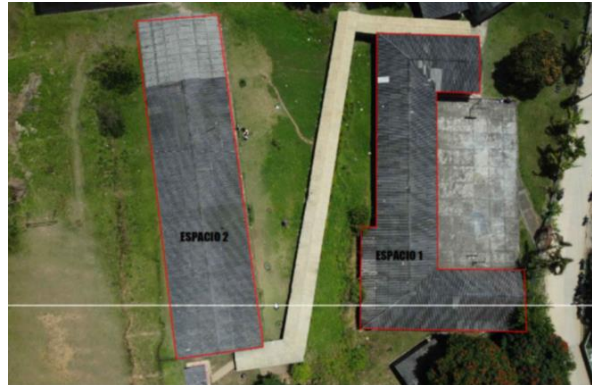
SEDE DE NIÑAS